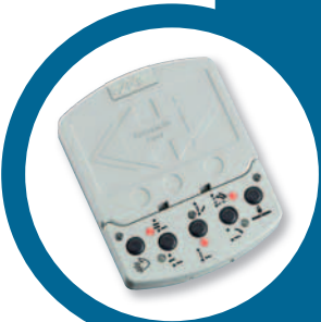
ovládací klávesnice KP Controller