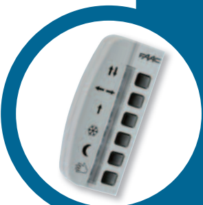
ovládací klávesnice SDK Light